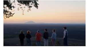
andriess-eeyck galerie RORY PILGRIM THE UNDERCURRENT, 2019, HD Film, 50:00

Een overzicht van de deelnemers van Projections: Projections