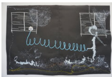
Thierry Oussou Lumen Travo Galerie Untitled 2020 203 x 301 cm