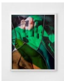
Vytautas Kumža Galerie Martin van Zomeren Fingertip (2021) Ink-jet print on archival paper, stained glass, lead, aluminium frame, 50 x 40 cm