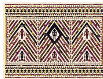
Jennifer Tee Galerie Fons Welters Tampam the collected bodies, 184 x 135 cm

De uitreiking van de NN Award vindt plaats in de van Nellefabriek op woensdag 9 februari, om 12.30 uur. De winnaar ontvangt een geldprijs van € 10.000,-; bovendien koopt NN Group een of meerdere werken van de vier genomineerden voor haar bedrijfscollectie.