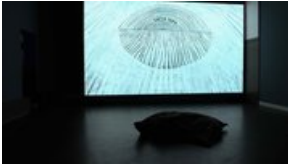
Galerie Maurits van de Laar Robbie Cornelissen Terra Nova, 2021, a sound design: Uli Kürner, editing: Sara Cornelissen