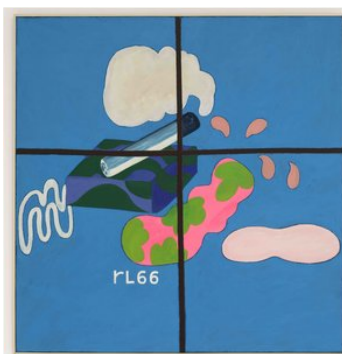
Willem Baars Projects Lucassen Stilleven, 1966