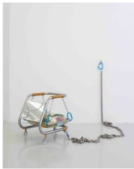
Gas 9 Gallery Maiben Bent, Fixtures, 2022

Te zien in overige secties op Art Rotterdam: