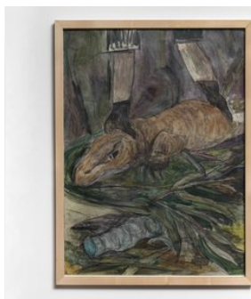
M.Simons, Hadrien Geronon Rotting the Ripening (komodo dragon), 2017