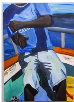
Brinkman & Bergsma Eugenie Boon, "Tir'un liña", 2021