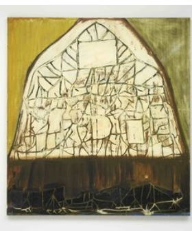
Pizza Gallery Jonas Dehnen "map with two skies", 2022