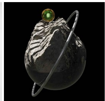
Brad Wolff & Partners Jaehun Park, Traveling Buddha, 2022