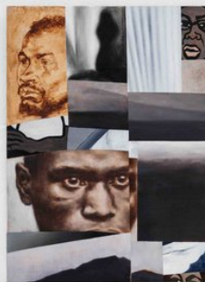
Go Mulan Gallery Dion Rosina, 'Do we really want to know about the future? #1', 2022