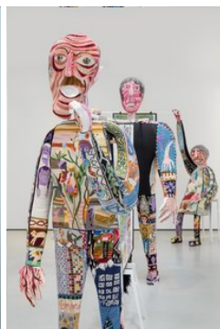
MadévanKrimpen Klaas Rommelaere DarkUncles, 2021